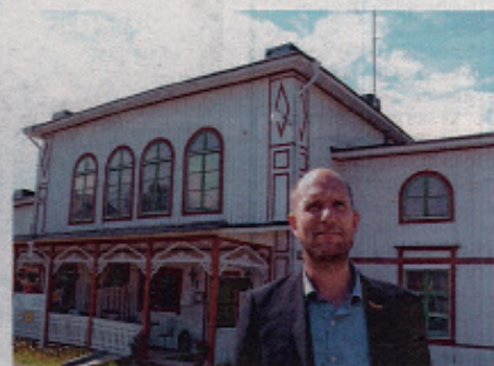
"Varje kommun måste nu sätta sig ner i dialog med näringslivet och fråga sig vilka förändringar man vill se framåt", säger Svenskt näringslivs regionchef Mats Andersson.